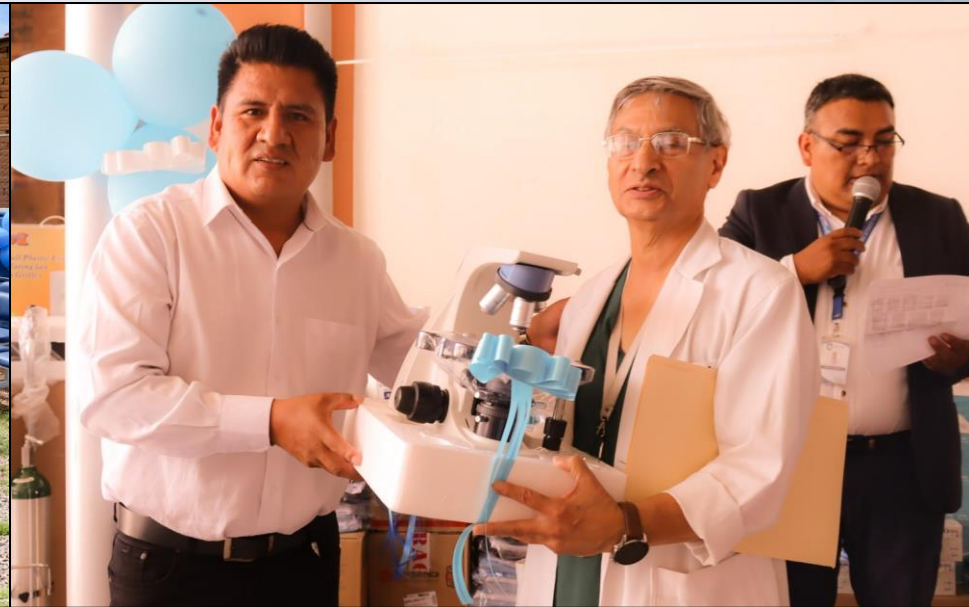
Entrega Equipamiento Hospital México