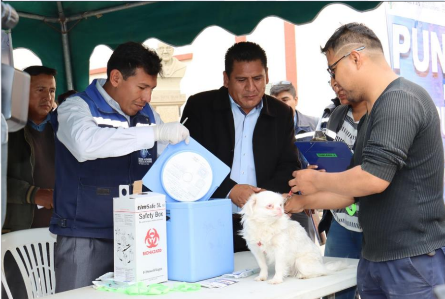
Inicio de Campaña de Vacunación Canina y Felina

En la gestión se intervino 830 cirugías de esterilización a canes y felinos en el Municipio de Sacaba, de esta manera se redujo el 1.5% en la reproducción de canes y felinos.