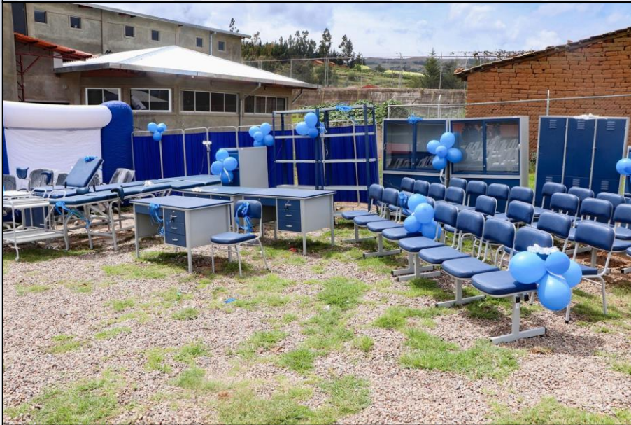
Entrega Mobiliario Medico C.S. Ucuchi

Se fortaleció con la dotación de Equipamiento médico, Maquinarias, Muebles y computación a los establecimientos de Salud para mejorar la calidad de atención a la población.