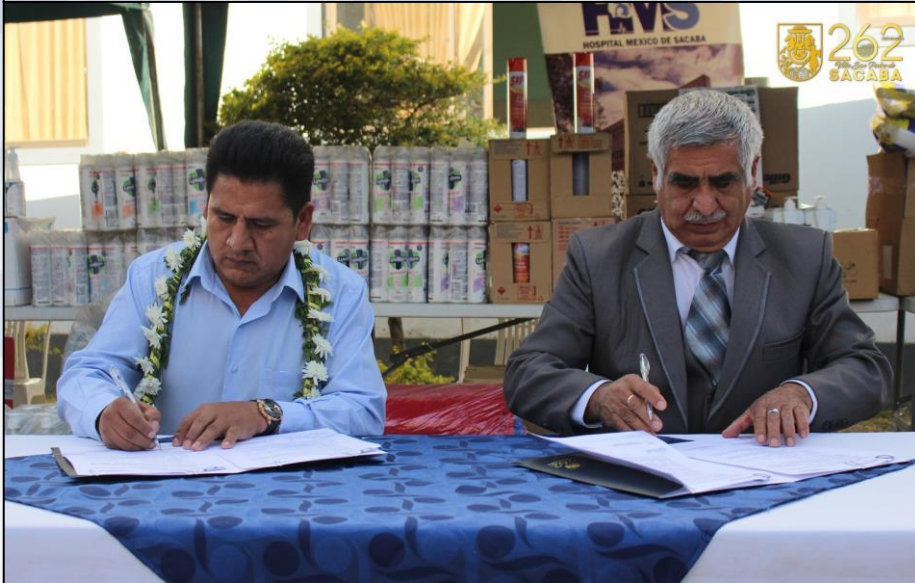
Firma de Convenio Universidades Privadas

Firma de Convenio de cooperación mutua entre el GAMS y las Universidades Privadas (UPAL, UNIVALLE, UDABOL, UNITEPC, UNICEN, ULAT y otros) para el fortalecimiento de hospitales con Equipamiento médico, Medicamentos, reactivos, Insumos Médicos y Otros.