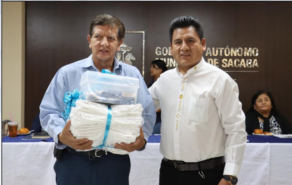
Entrega de Ropa de Trabajo

Durante la gestión se garantizó con la dotación de Materiales, insumos y suministros a personal de Salud, Administrativo y Manuales para el funcionamiento y atención a la población. (Escritorio, Limpieza, Imprenta, Ropería, Electricos, Plomería, Víveres, Repuestos y Otros)