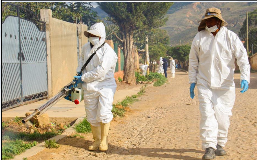
Evaluación de viviendas para la prevención de enfermedad de chagas

Se atendió el 100 % de las solicitudes recibidas para la fumigación y eliminación de vinchucas para prevenir la propagación de la enfermedad de chagas.