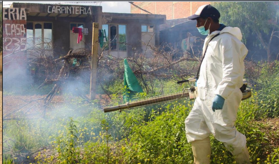
Fumigación de viviendas para la eliminación de vinchucas