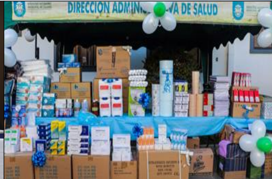
Materiales de Escritorio y Otros