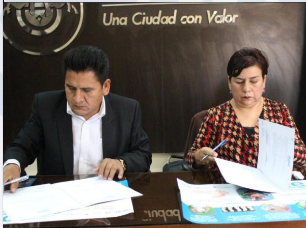
Firma de convenio “AYNINAKUNA”

Se Fortaleció a los Hospitales de Segundo Nivel para la atención de los pacientes que acuden con o sin discapacidad auditiva, además de discapacidad intelectual y autismo con dotación de personal e insumos a través de Convenio entre el GAMS y ALTIORA. (Atención 50 pacientes/mes)