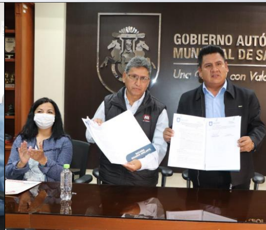
Firma de convenio Centro Altiora – Fe y Alegría