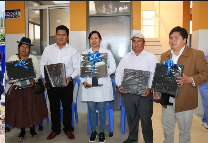
Equipamiento C.S. Korihuma 2