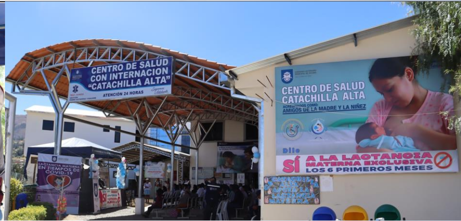
Habilitación del Centro de Salud Pacata