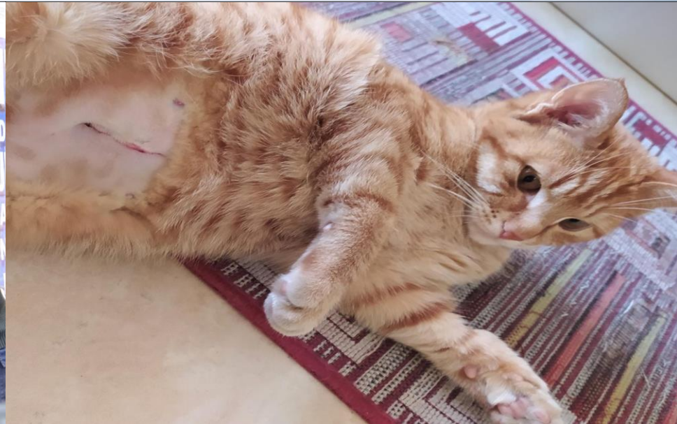
Cirugía de Esterilización (Gatita esterilizada)