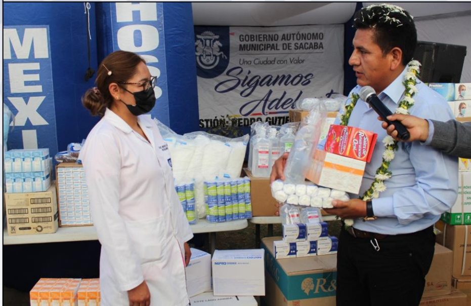
Entrega de Medicamentos a la Responsable de Hospital México

Se abasteció a los 24 establecimientos de salud con la dotación de medicamentos, reactivos, insumos médicos y odontológicos para atención a los pacientes del Sistema Único de Salud (SUS), Programas y a los pacientes externos.