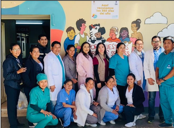
Personal de Salud y Administrativo

Se garantizó la seguridad a los 2 Hospitales de Segundo Nivel y el Centro de Salud Quintanilla con la asignación de 5 Policías a través de convenio con el comando departamental.