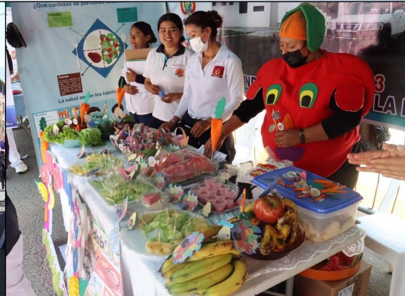
Feria de hábitos de vida saludable