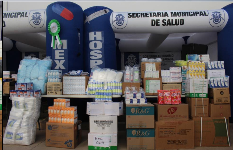
Medicamentos, Reactivos, Insumos Médicos y otros