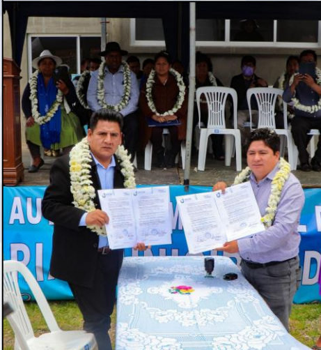
Firma de Convenio con F- TESIS

Se fortaleció los establecimientos de Salud de Distrito Ucuchi y Korihuma 2 con el equipamiento y mobiliario médico a través de la firma de convenio entre GAMS y F-TEISIS.