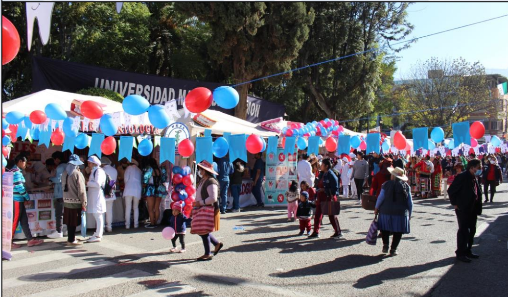
Feria integral de salud para el vivir bien.

Se organizó 5 Ferias Integrales de Salud para promoción de la salud y prevención de las enfermedades.