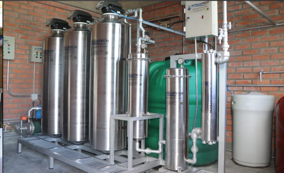
Planta de tratamiento de Agua Hospital Solomon Klein