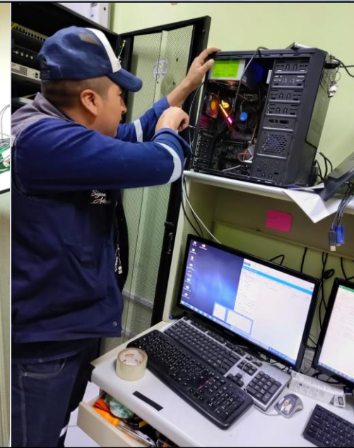
Mantenimiento de Sistemas