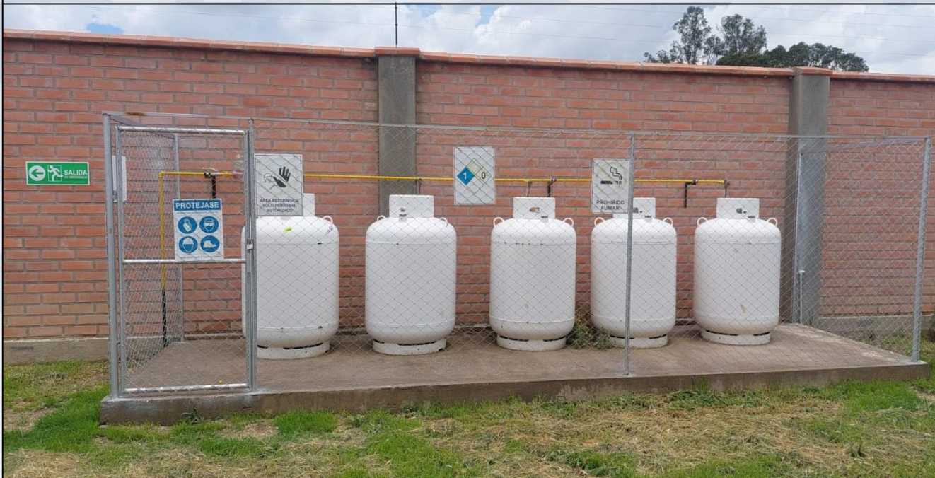
Central de Gas CIRSA

Se garantizó los Servicios Básicos los 12 meses de la gestión a los establecimientos de salud, consultorios vecinales y la Unidad Zoonosis para la atención a la Población.